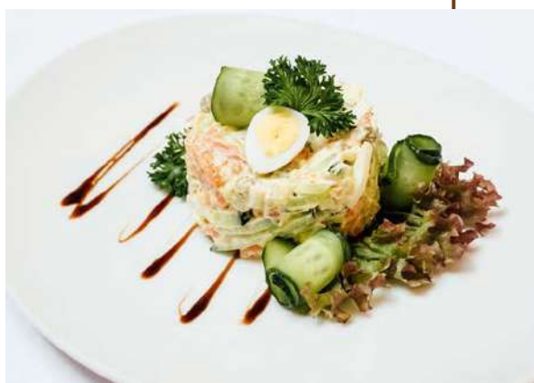
Салат «Император» с семгой