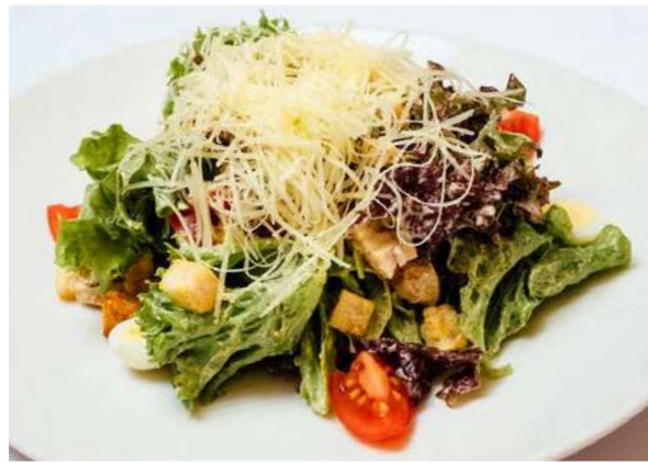
Цезарь с курицей

куриное филе, микс салата, томаты Черри, сыр Пармезан, чесночные сухарики, соус Цезарь