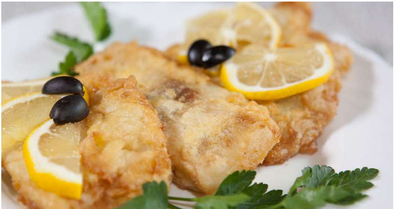
Судак в кляре