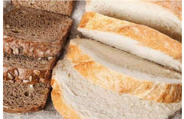
Хлеб белый, черный 200 г 100 р