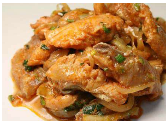
Сазан под маринадом

сазан, морковь, лук, белый корень, томатная паста, специи