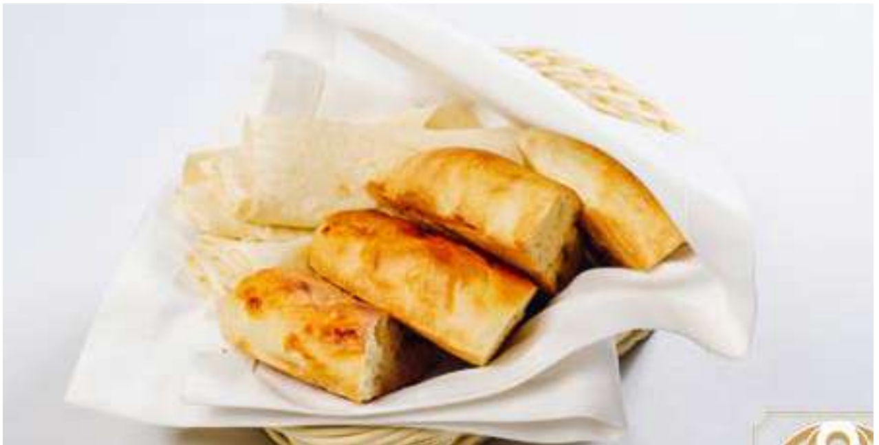
Хлебная корзина кавказская