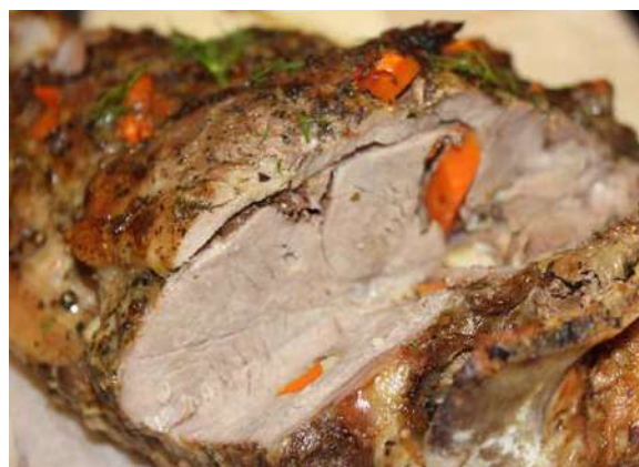
Буженина по-домашнему с кореньями