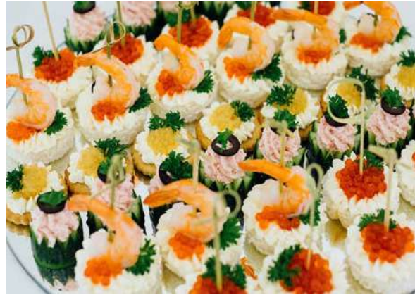
Канapé с красной икрой