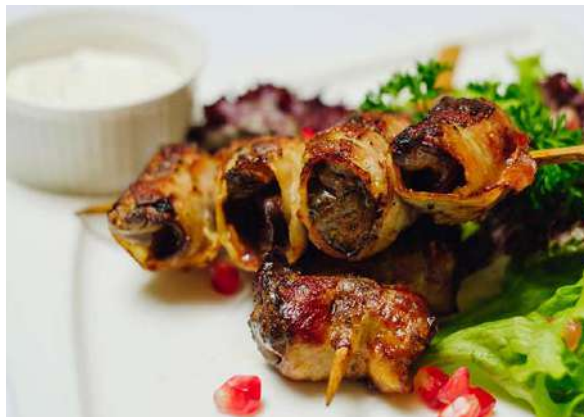
Куриная печень в беконе