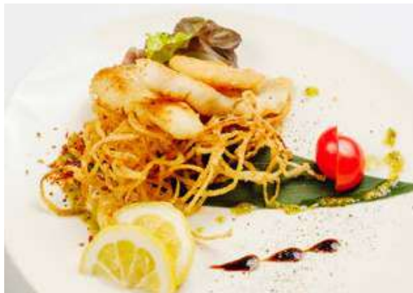
Судак жареный (подается с золотистым лучком)