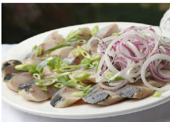
Сельдь с лучком

филе слабосоленой сельди, маринованный лук, душистое масло