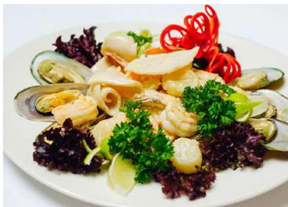
Морепродукты в сливочно-чесночном соусе

креветки тигровые, кальмар, осьминог, мидии