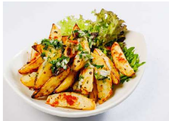
Картофель, запеченный с разнотравьем

картофель, масло растительное, смесь трав