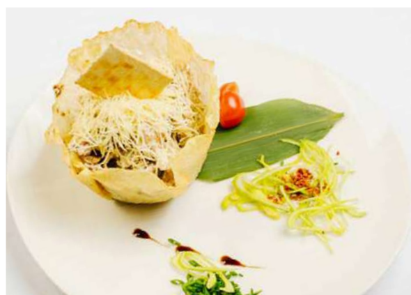
Салат три мяса с домашним майонезом

язык отварной, сыр Чеддер, отварная телятина, куриное филе, грибы жареные