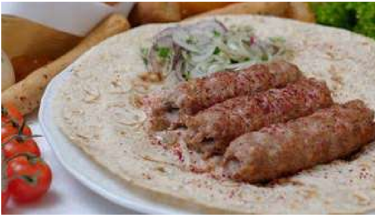
Люля-кебаб из баранины