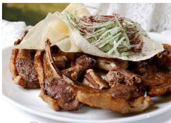
Шашлык из баранины (корейка, семечки, мякоть) баранина, лук репчатый, специи