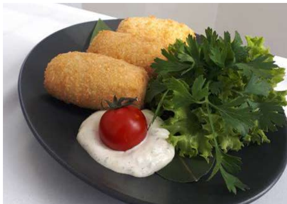
Рулеты из языка

говяжий язык, помидор, перец болгарский, огурец свежий, огурец маринованный, грибы маринованные