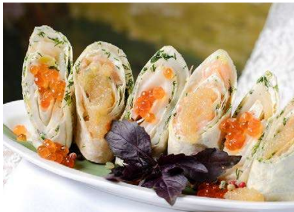
Рулетики из домашнего лаваша, рыбки и щуьей икры