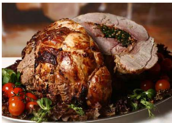
Окорок свиной, с можжевеловыми ягодами

свинина, лук репчатый, можжевеловые ягоды