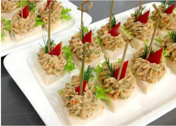
Пате из сельди на гренках