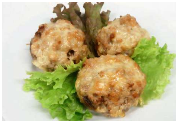
Грибы фаршированные мясом

шампиньоны, свинина, говядина, лук, болгар. перец, красное вино