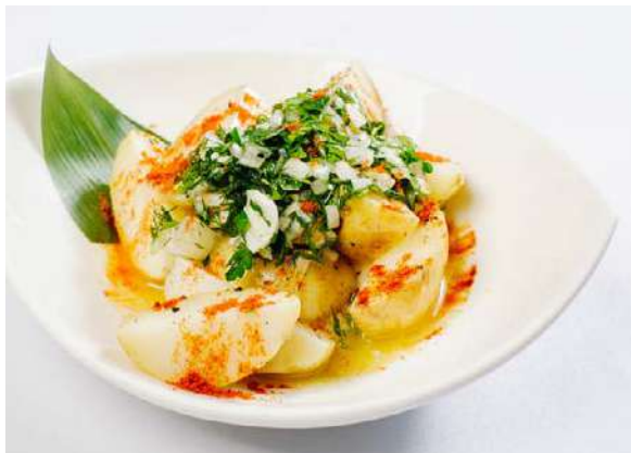
Картофель отварной с пряным маслом

картофель отварной, масло растительное, зелень