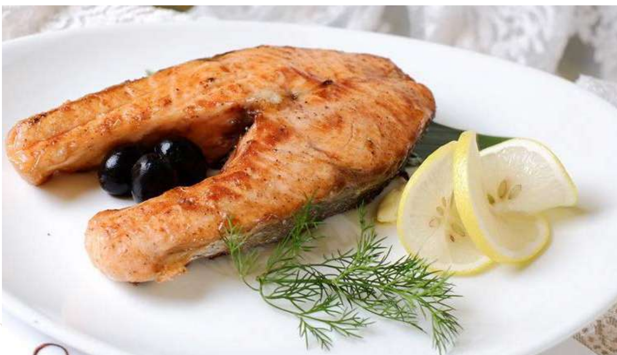
Шашлык из семги