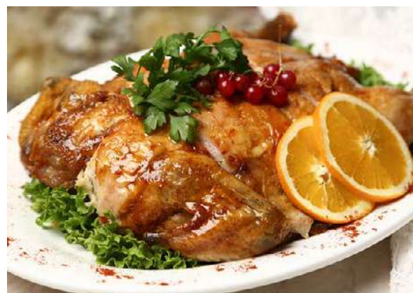
Курица, фаршированная печенью и грибами

курица, блины, печень куриная, лук, специи