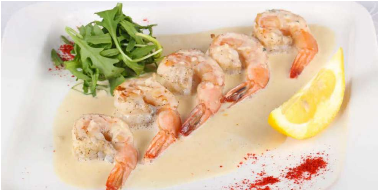
Тигровые креветки в сливочно-творожном соусе