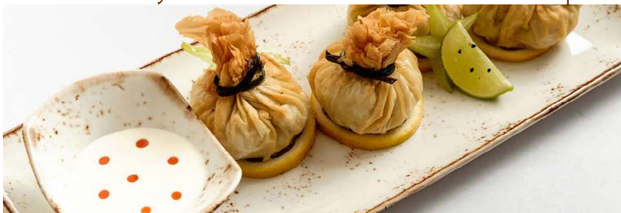
Мешочки с креветками