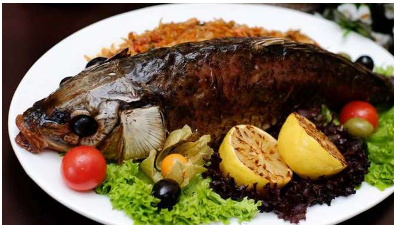
Сазан, фаршированный квашеной капустой и икрой сазан, капуста квашеная, икра, коренья