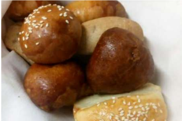
Хлебная домашняя корзина 250 г 390 р