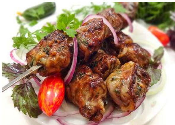
Печень телячья в жировой сетке

печень, сетка жировая, лук репчатый, специи