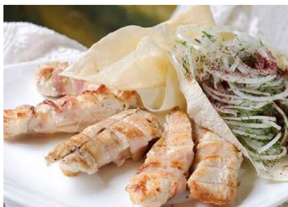
Филе индейки в беконе