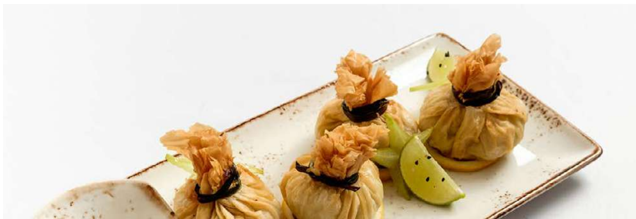
Мешочки с курицей