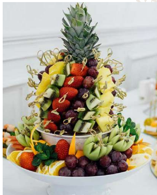
Фруктовая композиция «Премиум»