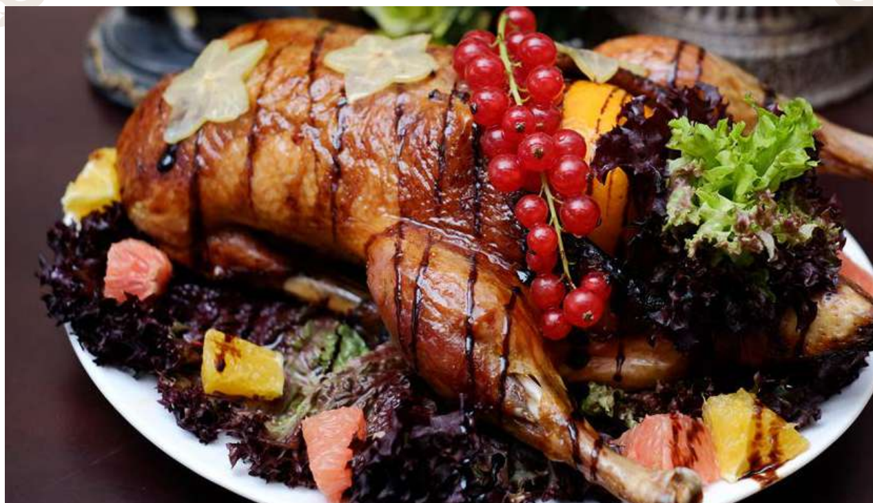
Утка медовая с яблоками