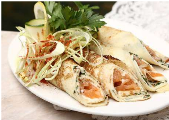
Блины с семгой