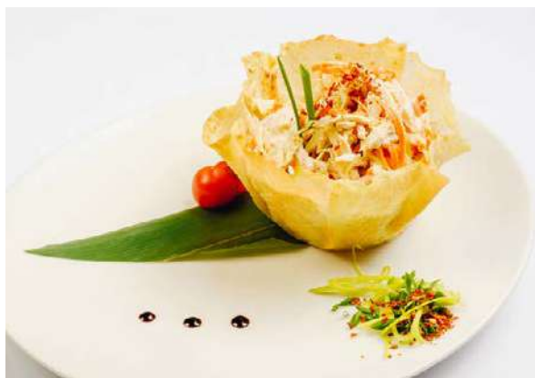
Салат мясной по домашнему рецепту с заправкой на основе перепелиных яиц

карбонат, куриное филе, копченая грудка, капуста пекинская, морковь, чеснок