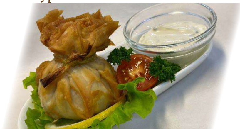
Мешочки со щукой