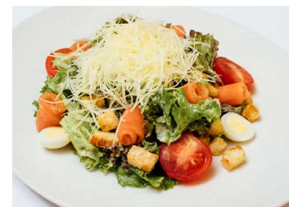
Цезарь с семгой

семга, микс салата, чесночные сухарики, томаты Черри, соус Цезарь, сыр Пармезан