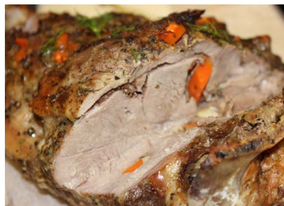
Буженина по-домашнему с кореньями