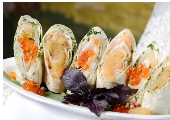
Рулетики из домашнего лаваша, рыбки и щуьей икры