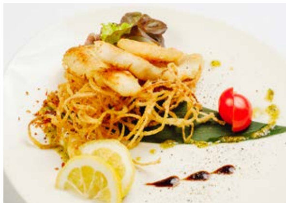
Судак жареный (подается с золотистым лучком) 230 г 750 р