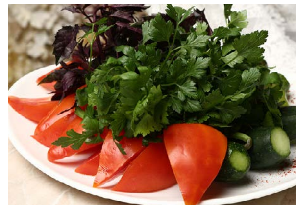
Коллекция из свежих овощей

помидоры, огурцы, болгарский перец, зелень