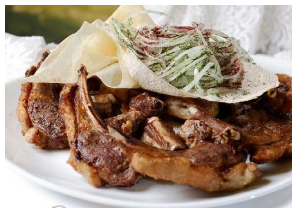
Шашлык из баранины (корейка, семечки, мякоть) баранина, лук репчатый, специи