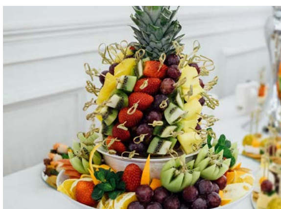
Фруктовая композиция «Премиум»