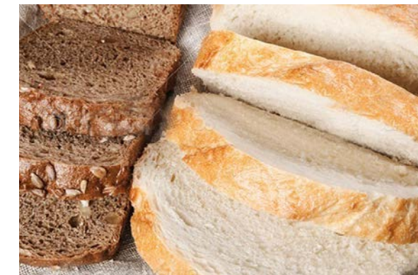
Хлеб белый, черный 200 г 100 р