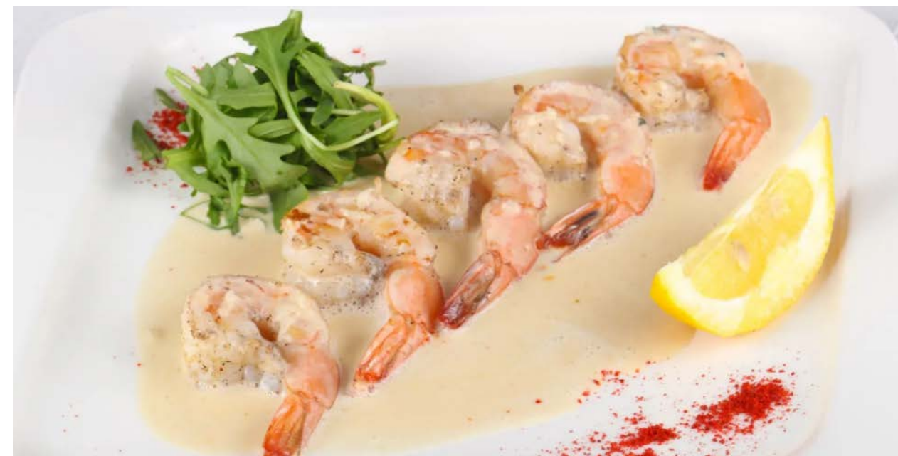
Тигровые креветки в сливочно-творожном соусе 200/30 г 1500 р