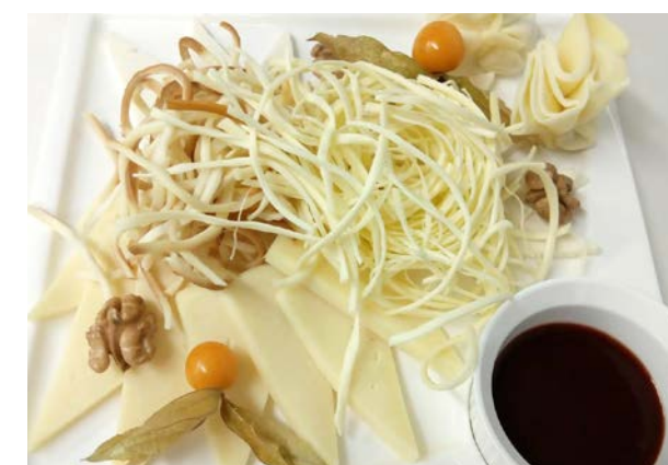
Ассорти из домашних сыров

сулугуни, чечил, овечий сыр, брынза, ткмали