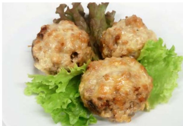
Грибы фаршированные мясом шампиньоны, свинина, говядина, лук, болгар. перец, красное вино 200 г 690 р