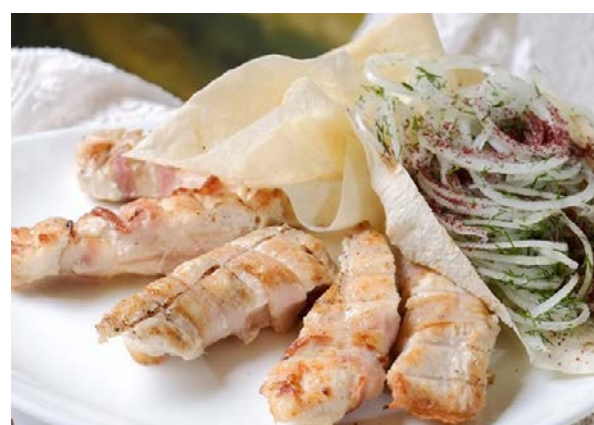
Филе индейки в беконе