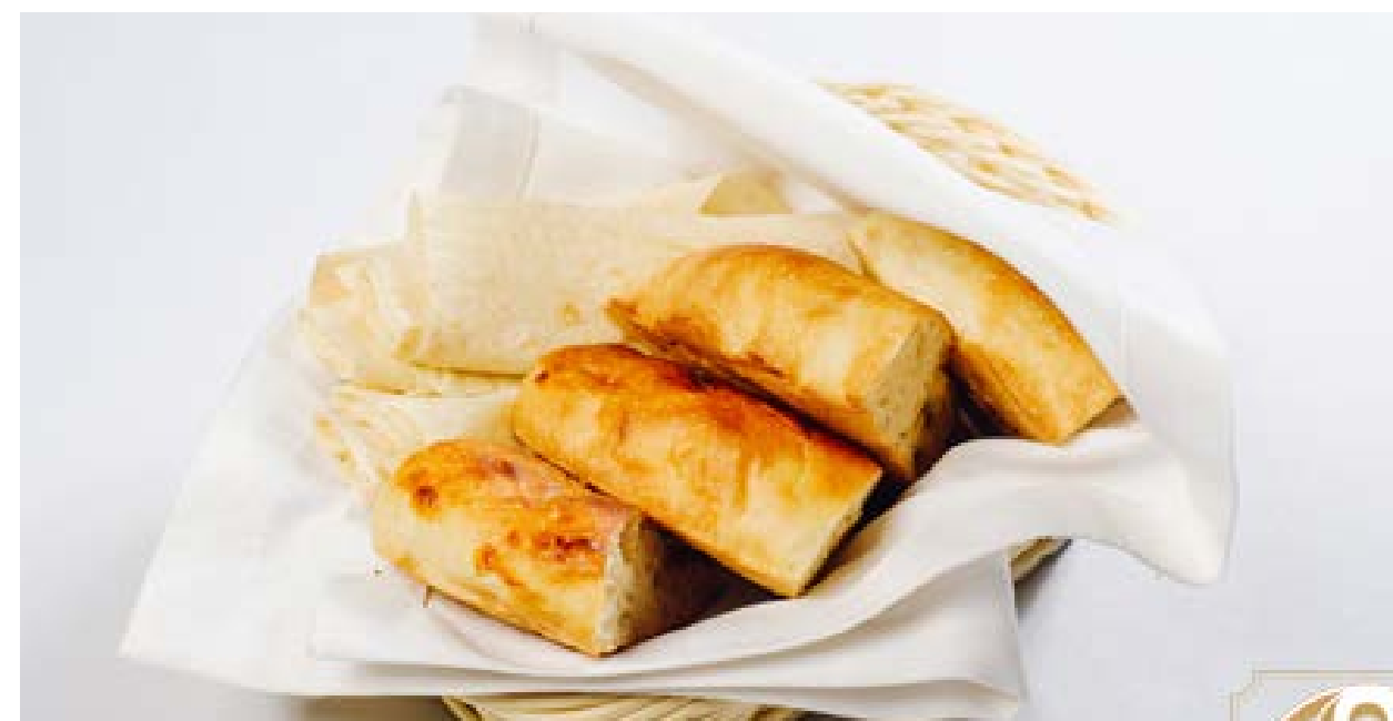
Хлебная корзина кавказская