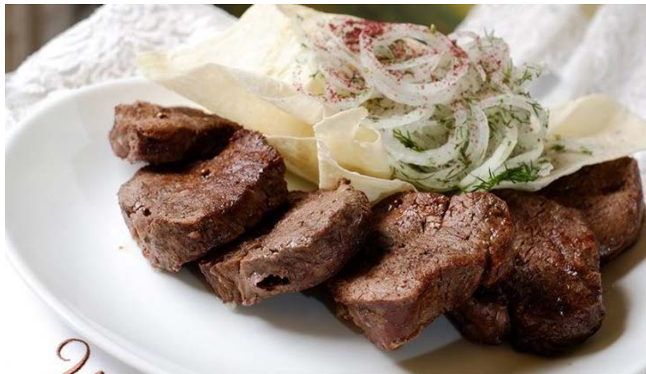
Шашлык из телятины (вырезка) телятина, лук репчатый, специи