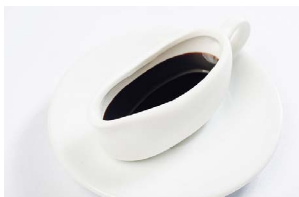
Наршараб 100 г 200 р