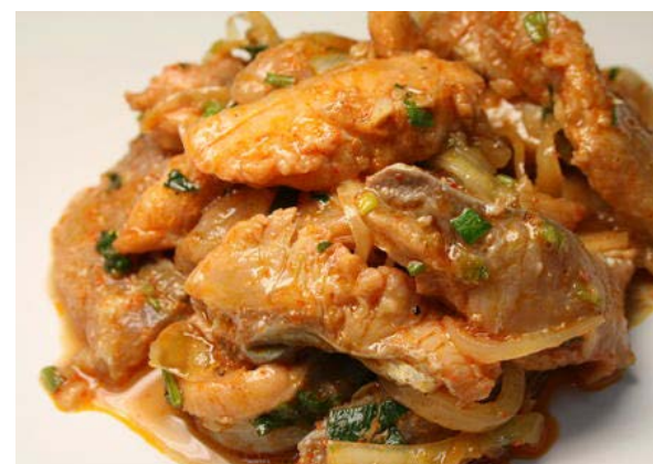
Сазан под маринадом

сазан, морковь, лук, белый корень, томатная паста, специи