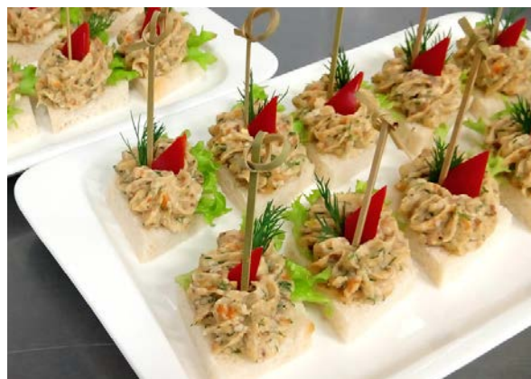
Пате из сельди на гренках