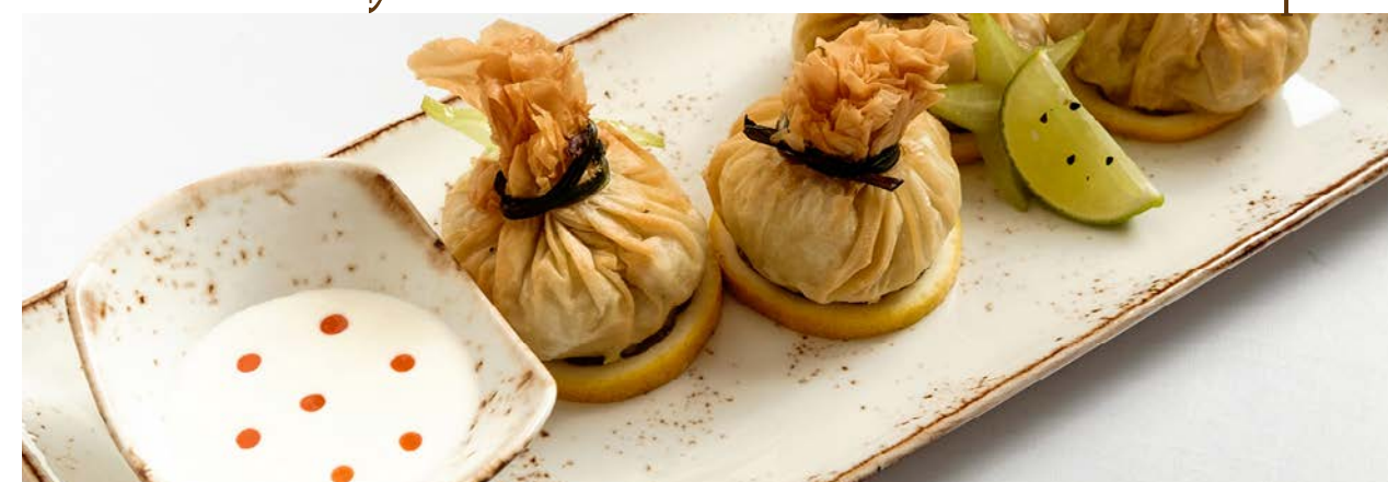
Мешочки с креветками