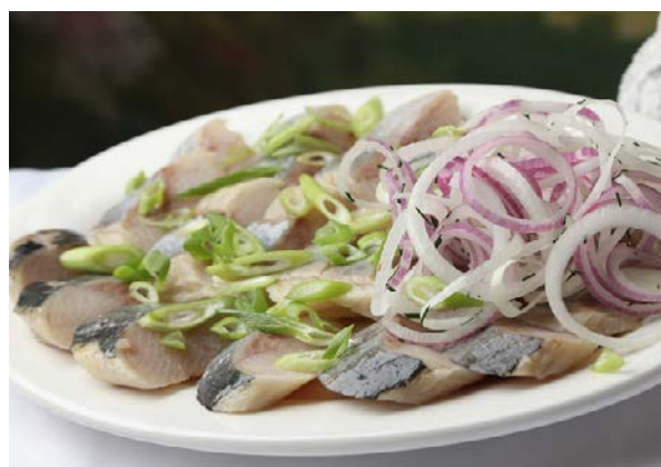
Сельдь с лучком

филе слабосоленой сельди, маринованный лук, душистое масло