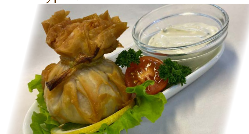
Мешочки со щукой