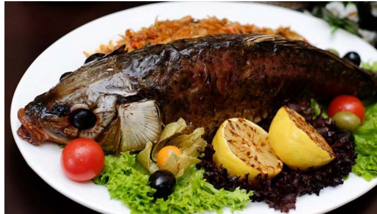
Сазан, фаршированный квашеной капустой и икрой