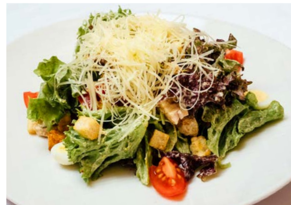
Цезарь с курицей

куриное филе, микс салата, томаты Черри, сыр Пармезан, чесночные сухарики, соус Цезарь