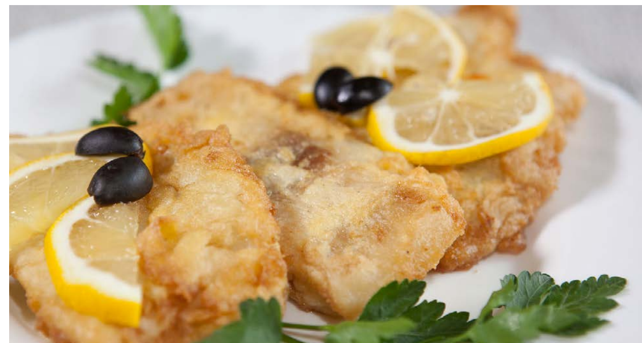
Судак в кляре 230 г 790 р