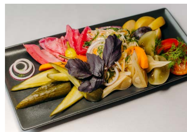
Ассорти из солений

помидоры соленые, огурцы соленые, капуста квашеная, чеснок, перец цизак