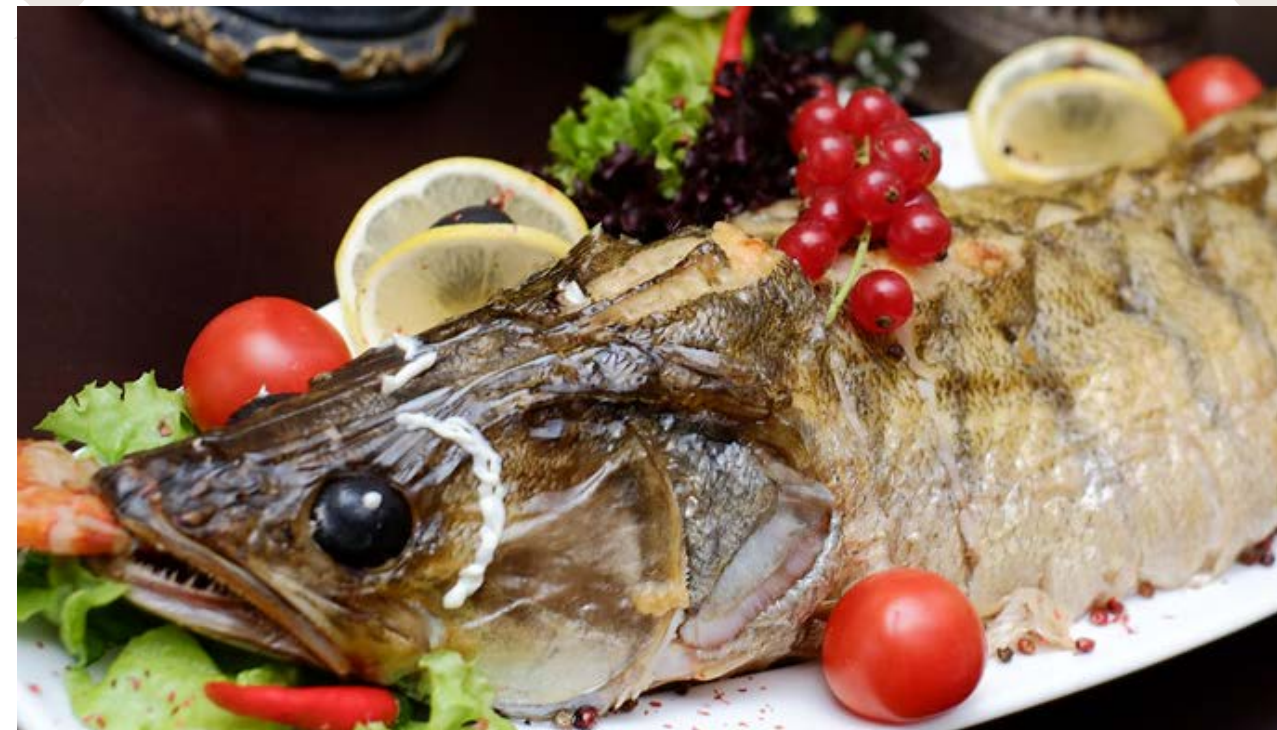
Судак, фаршированный красной рыбой