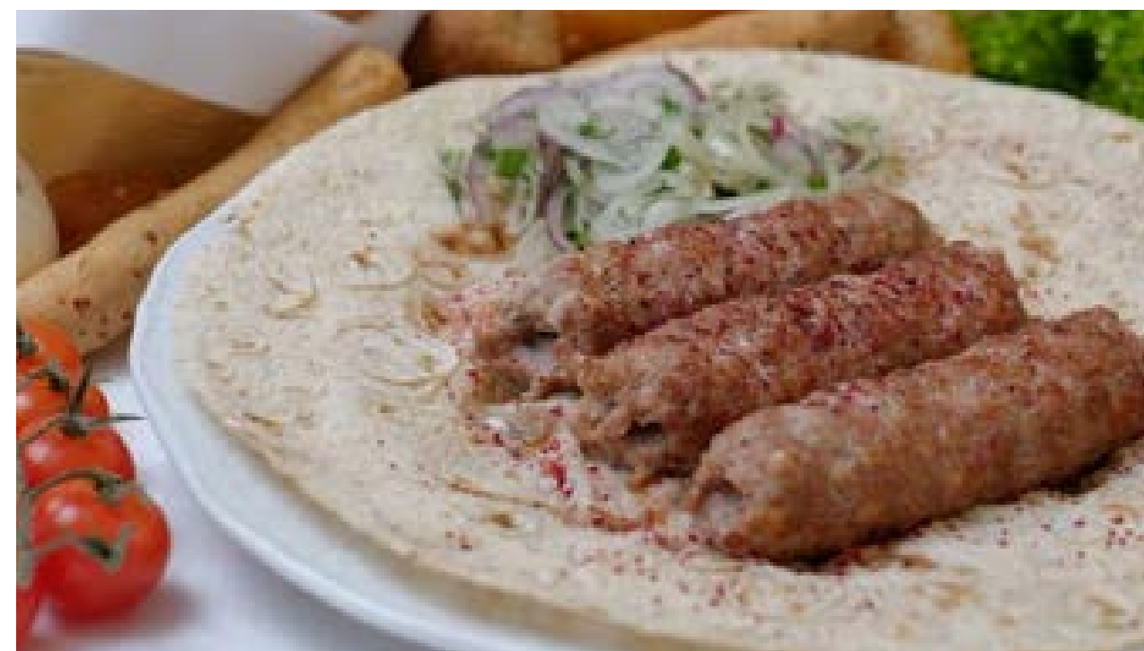
Люля-кебаб из баранины