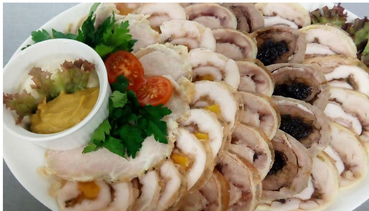
Коллекция мясных рулетов по-домашнему куриный рулет с ветчиной, утиный рулет с беконом, буженина, домашняя колбаска, хрен, горчица, зелень