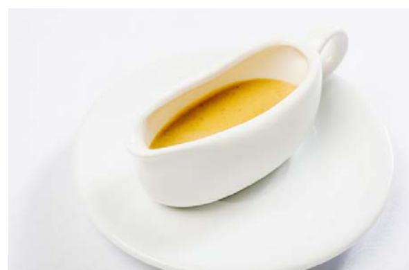
Горчица 100 г 120 р