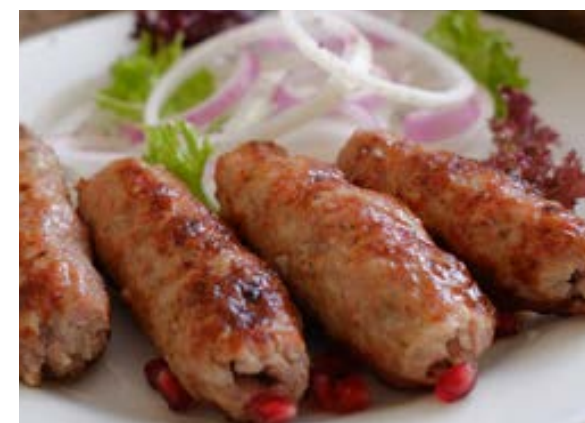
Люля-кебаб из свинины и говядины