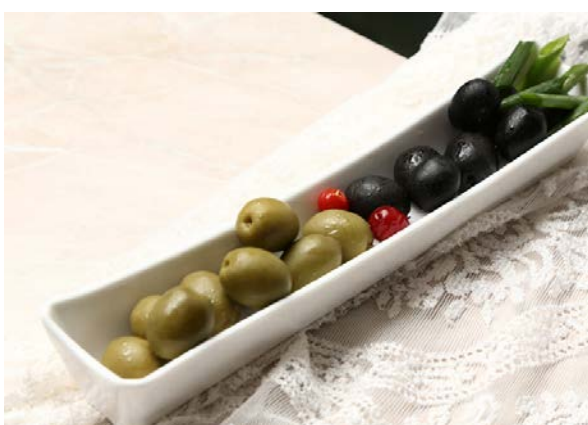
Плато из маслин и оливок