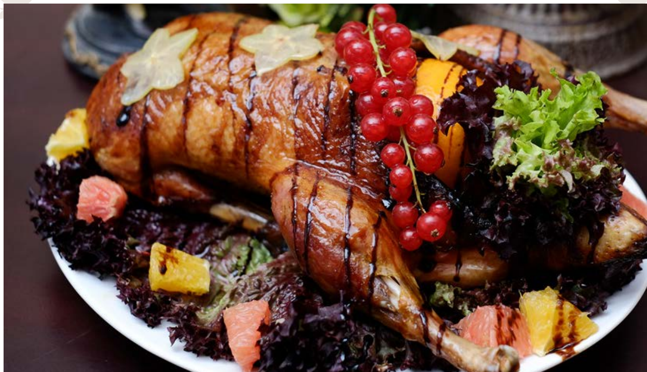
Утка медовая с яблоками