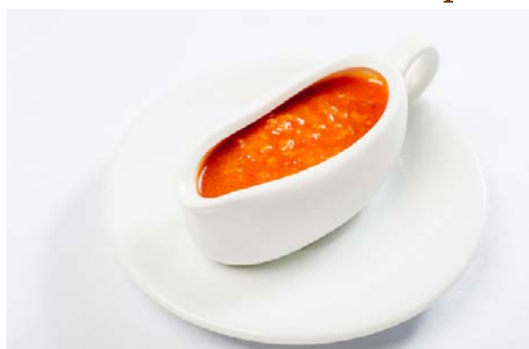
Ткемали 100 г 150 р