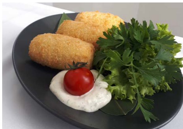
Рулеты из языка

говяжий язык, помидор, перец болгарский, огурец свежий, огурец маринованный, грибы маринованные