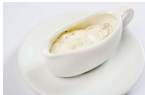
Белый соус 100 г 120 р