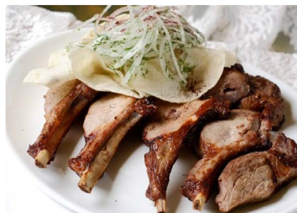
Шашлык из свинины (корейка, карбонад, шея) свинина, лук репчатый, специи