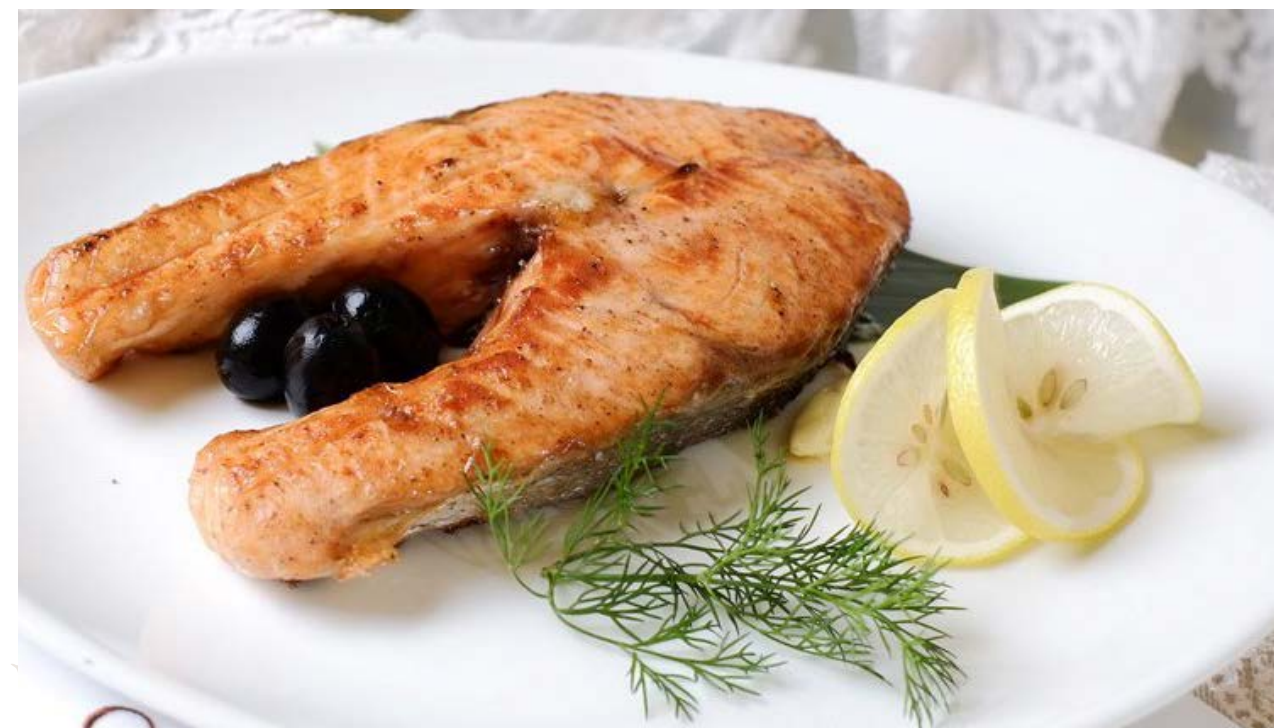
Шашлык из семги