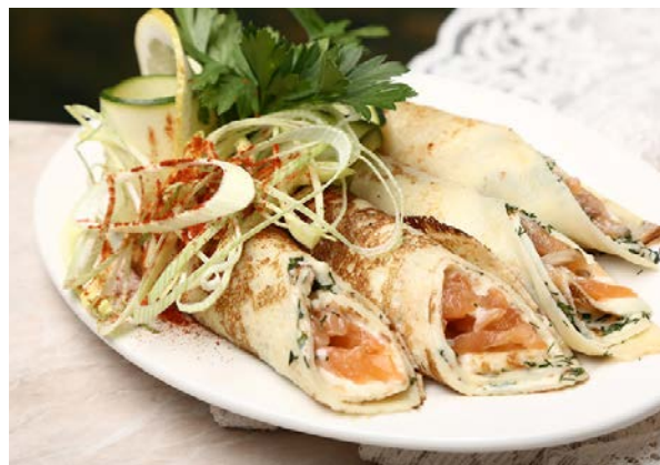
Блины с семгой