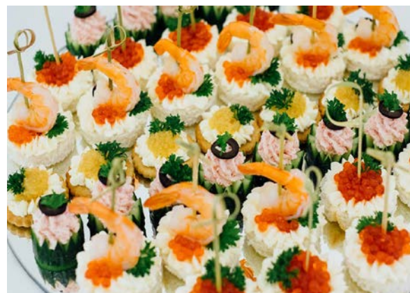
Канapé с красной икрой