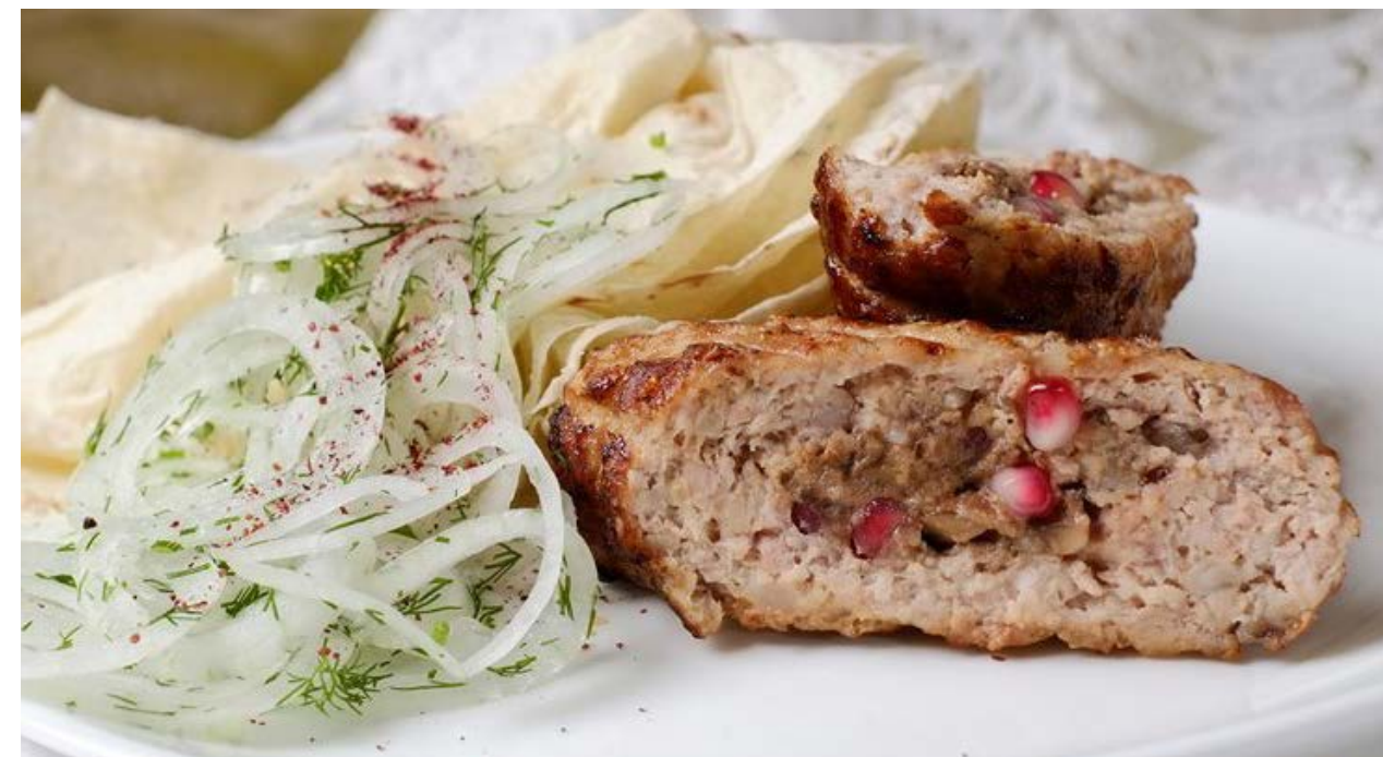
Люля-кебаб, фаршированный грибами, орехами, сыром, гранатовыми зернами на Ваш выбор: курица, свинина, говядина, баранина