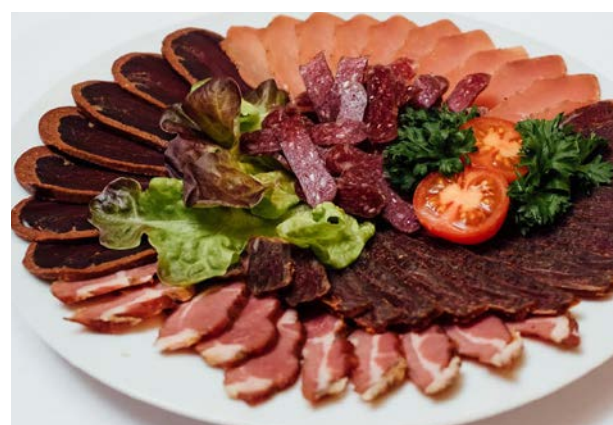
Мясное ассорти из вяленого мяса

говядина сыровяленная, свинина сыровяленная, бастурма, суджук, пастрома