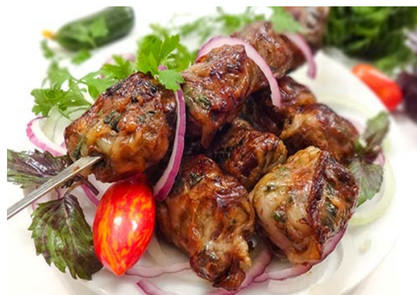
Печень телячья в жировой сетке

печень, сетка жировая, лук репчатый, специи