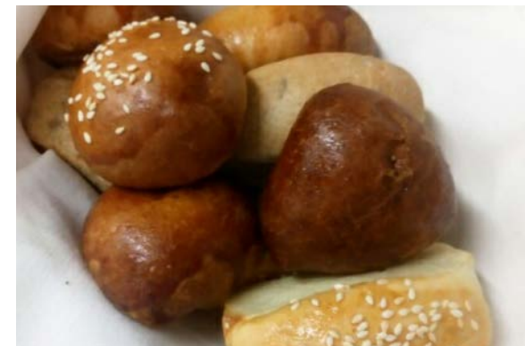
Хлебная домашняя корзина 250 г 350 р