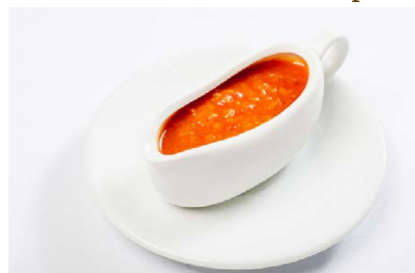
Красный соус 100 г 120 р