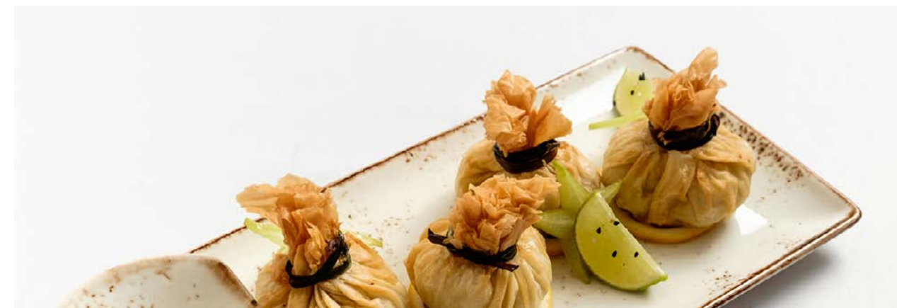
Мешочки с курицей