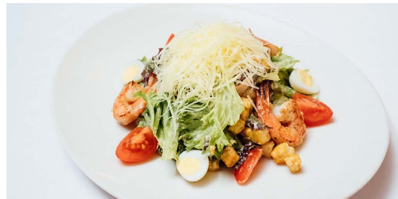
Цезарь с креветками

обжаренные креветки, разнотравье, микс салата, чесночные сухарики, сыр Падано